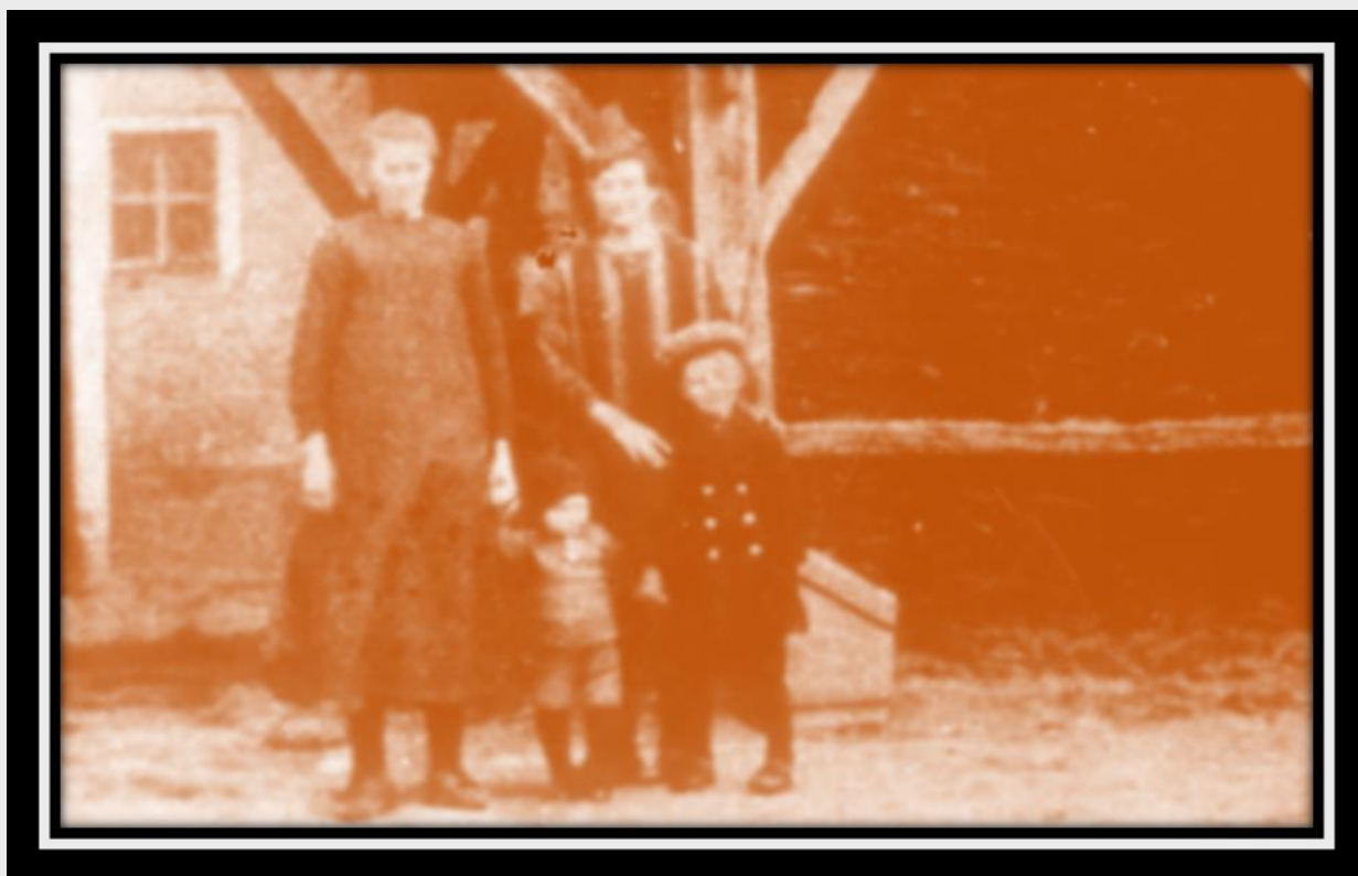
Armoede, of soberheid (?) eind 19 e eeuw

Over het afgegraven veen zweven nog altijd de weemoedige klanken van een lied vol jammer en melancholie. Het werd met een rochel in hun keel gezongen door de knoestige veenkers rond hun koffievuurtje. De oudste van het stel speelde wat uithalen op zijn mondharmonica en had de plicht om als eerste met een vette kwalster het vuurtje uit te spuwen. "Hort, wij möt weer gaangs!"