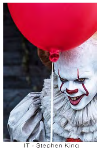
IT - Stephen King