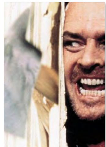
The Shining - Stephen King

Nu hoor ik je denken: “Bang? Wat een onzin!”, en die gedachte is ook logisch. Zeker als je niet weet dat ik door mijn leventje heen een groot fan ben geworden van griezelfilms. Iets wat begon toen ik als klein jongetje, dat niet kon slapen, de woonkamer inliep en per ongeluk getuige werd van de douchegordijnscene van de Shining,