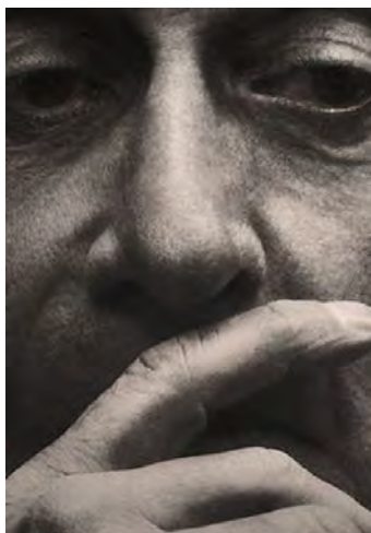
The Staircase - Netflix

Inmiddels is het winter. De dagen zijn kort en donker en het weer is guur in Orvelte. Langzaam begin ik te begrijpen wat mijn maatje bedoelde. Overdag nog een enkele toerist die spontaan de tuin inloopt, maar 's avonds en 's nachts is het nu wel heel erg stil. Op het vreemde gegil van nachtelijke roofvogels na. Toen ik 's nachts even buiten stond te roken en er plotseling een uil voor mij langs vloog, deed ik toch even een stapje achteruit omdat ik de documentaire 'The Staircase' op Netflix had gekeken. Orvelte is best eng in de winter en kan zo een griezelfilm in.