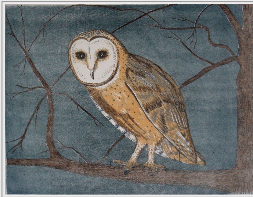
Litho 'Kerkuil', 5 kleurendruk, oplage 22. Formaat: 40 x 32 cm.

Eens verraste ik er één overdag, in de winter. Hij zat in onze kapschuur een beetje te slapen. Hij schrok en vloog vlak voor mij langs naar een tak in onze grote berk. Daar bleef hij toen zomaar even zitten, met zijn vlakke witte hartgezicht naar mij gekeerd. Heel fijn, want die houding heb ik gebruikt voor mijn litho.